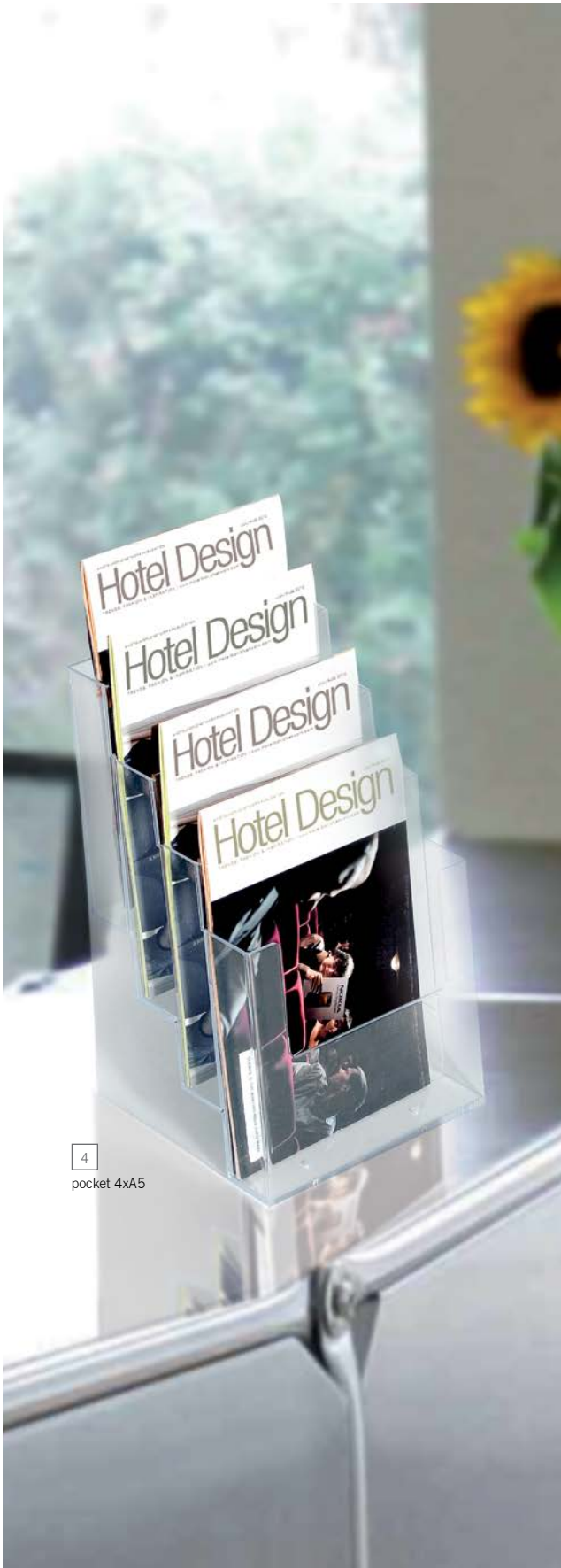
4 pocket 4xA5