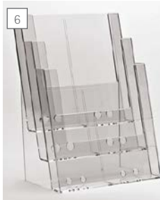
6 espositore da banco 3xA4. thekenaufsteller für 3xA4. counter display 3xA4.