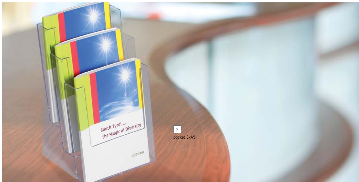
3 pocket 3x A5