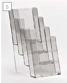
5 espositore da banco 4xA6L. thekenaufsteller für 4xA6L. counter display 4xA6L.