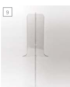
9 divisore per espositori da A4 in 2xA6L unterteilung für A4 aufsteller in 2xA6L. divider for A4 displays in 2xA6L.