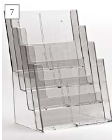
7 espositore da banco e da parete 4xA4. aufsteller für theke oder wand 4xA4. display for wall and counter 4xA4.