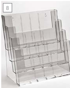
8 espositore da banco e da parete 4xA4 orizzontale. aufsteller für theke oder wand 4xA4 horizontal. display for wall and counter 4xA4 horizontal.